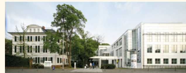
Die Villa Metzler mit dem benachbarten Museum Angewandte Kunst

→ In den Veranstaltungsräumen lassen sich Stehempfänge für bis zu 150 Personen ausrichten.