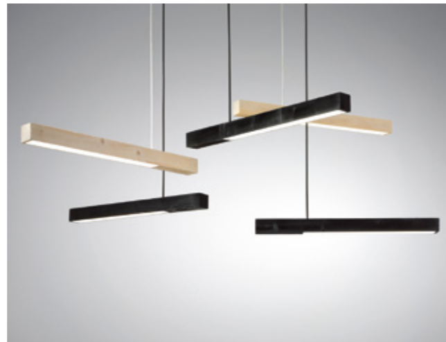
Blasted KL1 nature Maße: h 60mm x l: 805mm x w: 60mm. Material: Russian Pine, acrylic, aluminium, and cast iron with 4 meter fabric cord von Kai Linke 2010. Inv. Nr. V.999.