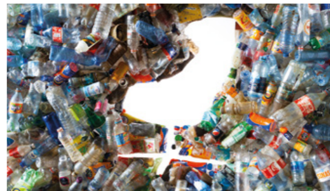
Stuhlserie »Felt«. PET- Upcycling. www.Vepa.de Büromöbel