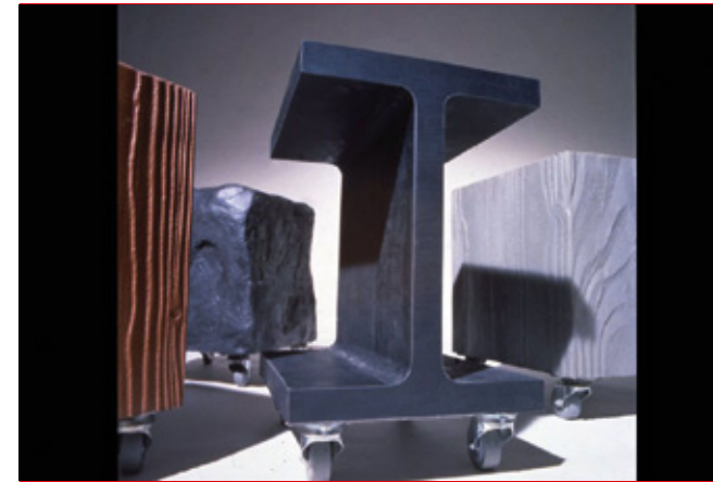
Volker Albus »Römerberg« Sitzgruppe 1987/88 Foto: Klaus Hagmeier / ELLE Decoration

Führung mit Walther König und Dr. Eva Linhart durch die Ausstellung »Erfolgsprogramm Künstlerbücher. Der Verlag der Buchhandlung Walther König«