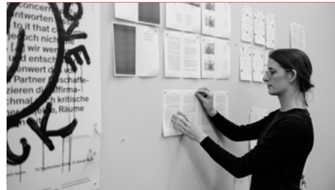
Momentaufnahme des Gestaltungsprozesses zu »Books & Bookster«

Aktuelle Informationen zur Veranstaltung auf www.polytechnische.de